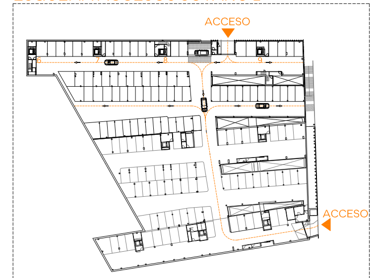
ESQUEMA ACCESOS SÓTANO 1