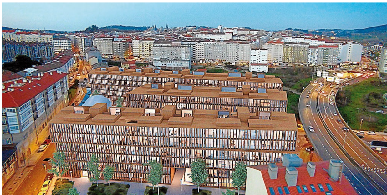
Aspecto que presentará el nuevo residencial de Cornes, que incluirá 125 viviendas y espacios verdes para el ocio