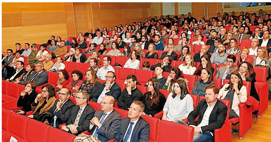
Participantes en la presentación del proyecto, ayer, en el Auditorio Abanca.

de Romero Donallo, la nueva estación intermodal y la recuperación del río Sar a su paso por estas zonas"; y también apuntó que "todo ello conformará el nuevo espacio urbano más importante de Santiago, con edificios, dotaciones y espacios verdes de alta calidad".