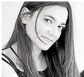
Guadi Galego Música

La artista Guadi Galego ofrecerá un concierto el próximo viernes 12 de mayo, en el teatro Principal. La cita arrancará a las 22.00 horas y el precio de las entradas oscila entre los 15 y los 20 euros.