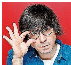
Luis Piedrahita Humorista

La artista Guadi Galego ofrecerá un concierto el próximo viernes 12 de mayo, en el teatro Principal. La cita arrancará a las 22.00 horas y el precio de las entradas oscila entre los 15 y los 20 euros.