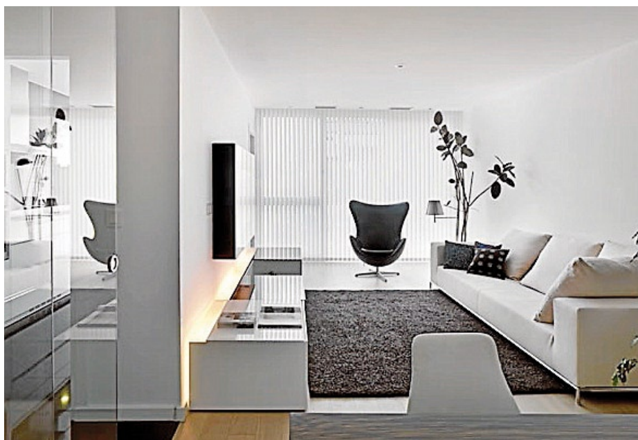
Uno de los espacios del piso piloto de la cooperativa, que ya ha adjudicado todo