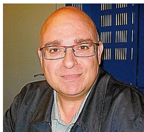
Paco Reyes Portavoz del PSOE

A las 12.30 horas está prevista en el pazo de Raxoi, la rueda de prensa del portavoz del Grupo Municipal Socialista, Paco Reyes. La comparecencia versará sobre asuntos de carácter local de actualidad.