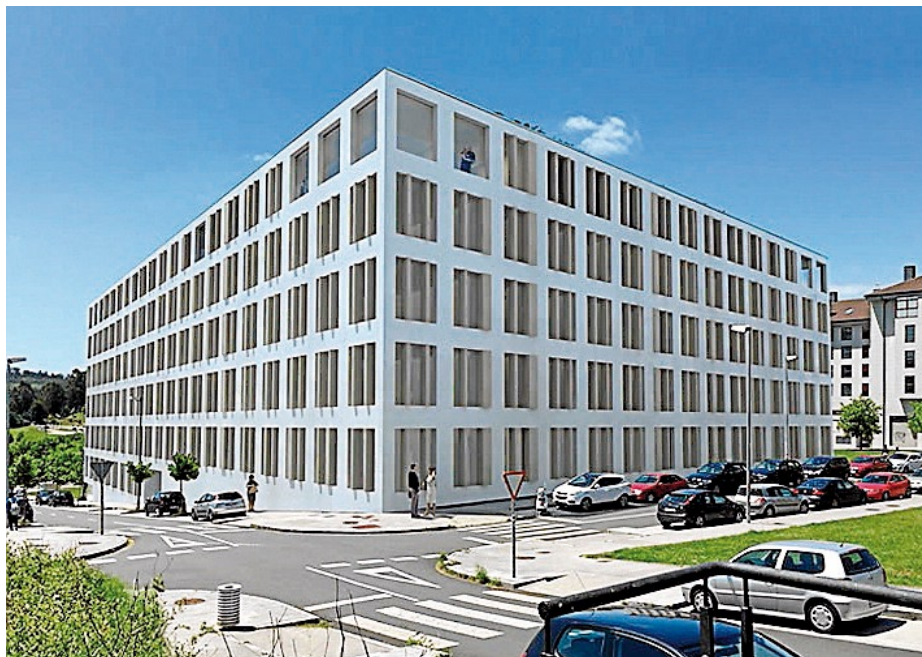
Imagen virtual del exterior del edificio proyectado para la Cooperativa Santa Marta