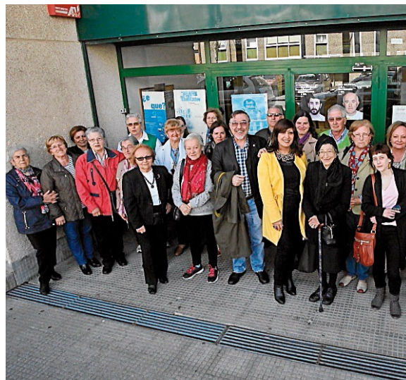
Coordinadora y asistentes al taller de Vite.

participación de más de medio millar de directivos. También se organizaron 19 almuerzos-coloquio, con invitados como el vicepresidente de Abanca o el conselleiro de Economía, entre otros. El Club Financiero formalizó dos convenios de colaboración y se consolidó en su papel de líder de opinión, posicionándose en temas de especial interés social en la capital gallega. REDAC.